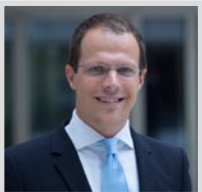
SEHR GEEHRTE DAMEN UND HERREN,

ERPROBTE LÖSUNGEN DES ARBEITSKREISES „INDUSTRIE 4.0 - BETRIEBSWIRTSCHAFTLICHE FRAGESTELLUNGEN IM FOKUS“