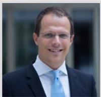
SEHR GEEHRTE DAMEN UND HERREN,

ERPROBTE LÖSUNGEN DES ARBEITSKREISES „INDUSTRIE 4.0 - BETRIEBSWIRTSCHAFTLICHE FRAGESTELLUNGEN IM FOKUS“